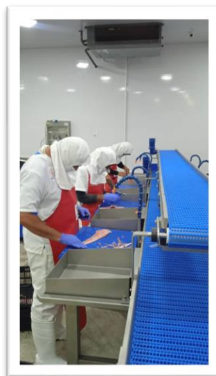
Área de procesamiento del Pescado